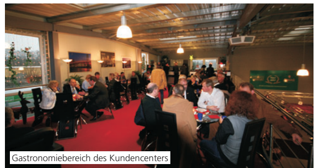
Gastronomiebereich des Kundencenters

Birgit Sperber, Verband unabhängiger Bestatter