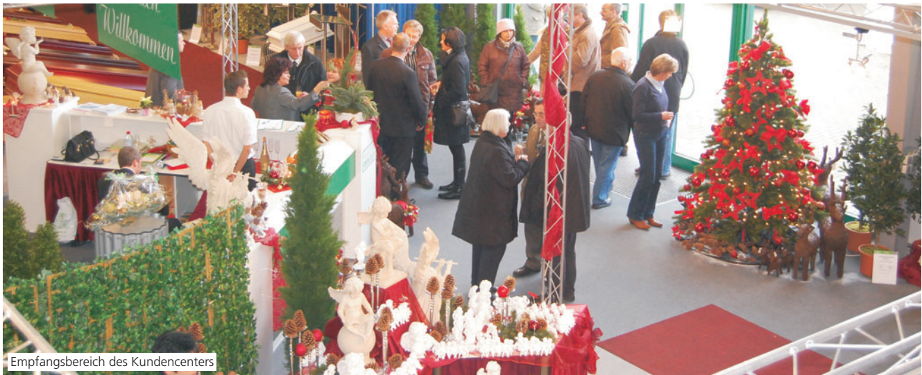
Empfangsbereich des Kundencenters

Die Familie Pludra und Ihr gesamtes Team hatten zum 6. Dezember 2008 eingeladen und es kamen so viele Kunden dass die Parkplätze nicht reichten und Hotelzimmer nachgebucht werden mussten. Neben Kunden aus der gesamten Bundesrepublik, kamen auch Kunden aus dem europäischen Ausland.